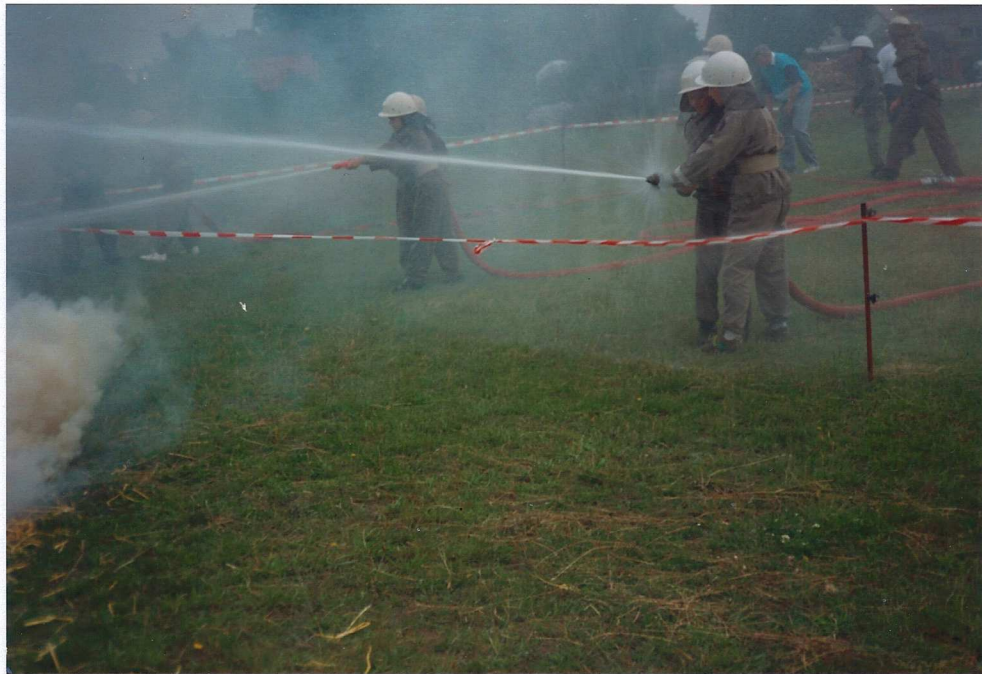
Steffen Boldt wird von der Jugendfeuerwehr mit einem Bad verabschiedet.