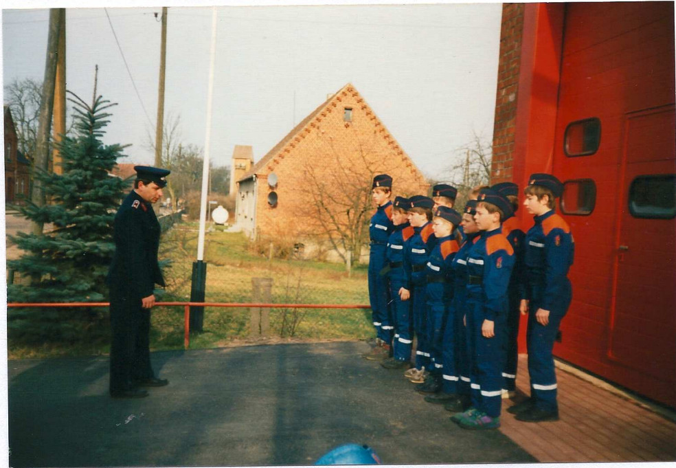
Im März 1995 wurde der Wimpel an die Jugendfeuerwehr übergeben